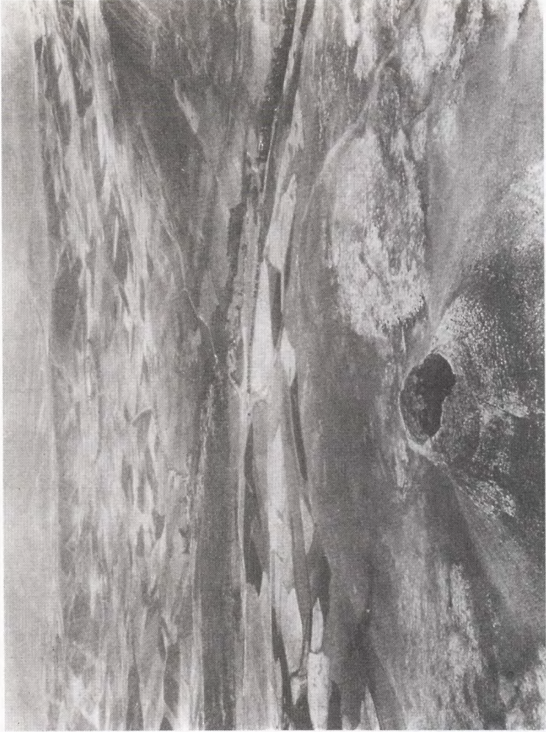
عکس هوایی از زندان سلیمان و تخت سلیمان